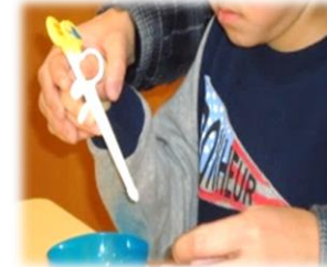
箸の練習 目と手の協応作業