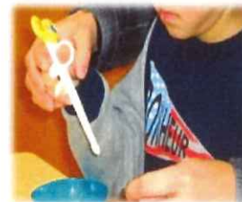
箸の練習 目と手の協応作業