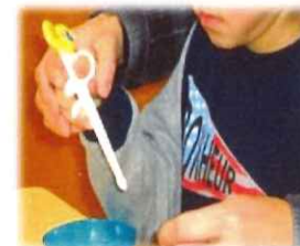
箸の練習 目と手の協応作業