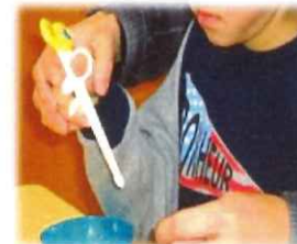
箸の練習 目と手の協応作業