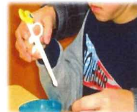
箸の練習 目と手の協応作業