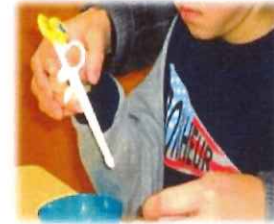
箸の練習 目と手の協応作業