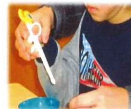
箸の練習 目と手の協応作業

お子様の様子やい〜まの指導を直接ご覧になっていただけるように保護者参観も実施しています。